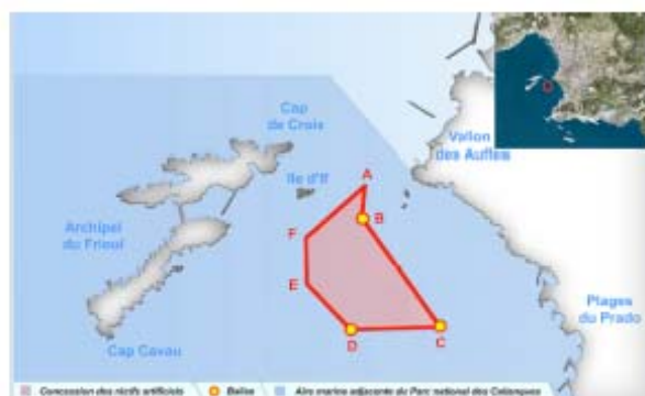
Figure 1 : carte d'implantation des récifs de Marseille