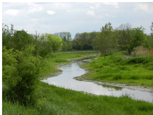
et après restauration