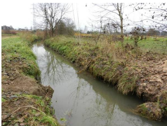
La Souffel avant

Les cours d'eau concernés par ces travaux, situés principalement dans la plaine agricole proche de Strasbourg, ont été très fortement perturbés, rectifiés, recalibrés et présentent un lit très encaissé. Par ailleurs, dans les secteurs concernés, les zones humides fonctionnelles, présentant des habitats favorables à la biodiversité, ont pratiquement toutes disparues.