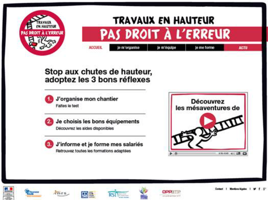
Home page du site www.chutesdehauteur.com