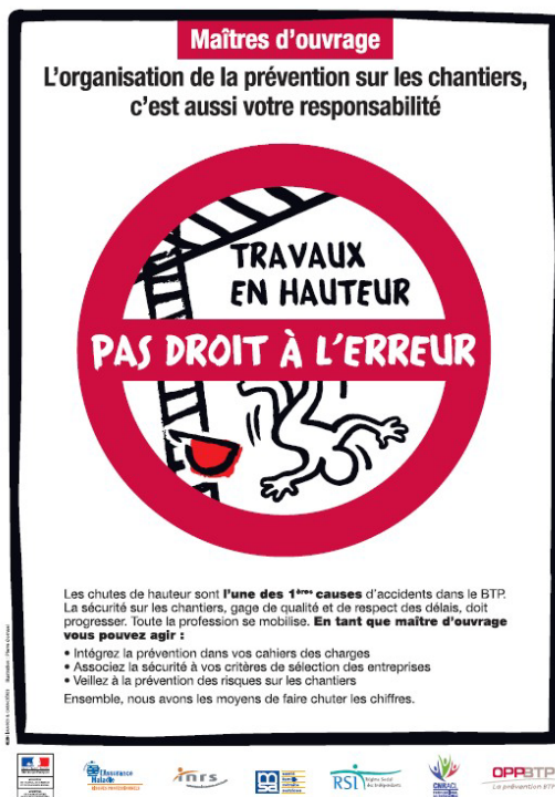
Affiche maitres d'ouvrage