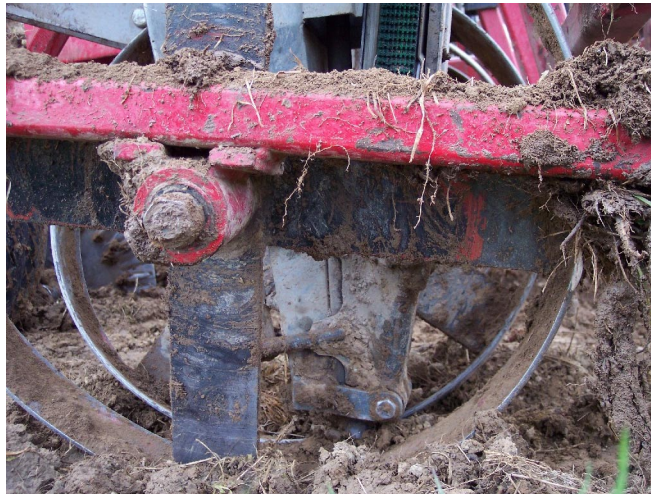
La bouture est plantée dans le sol par le dispositif de plantation. Deux roues tasseuses rappuient le sol sur la tige.

Principe de l'alimentation : Deux opérateurs alimentent un entonnoir qui surmonte une goulotte de descente ;