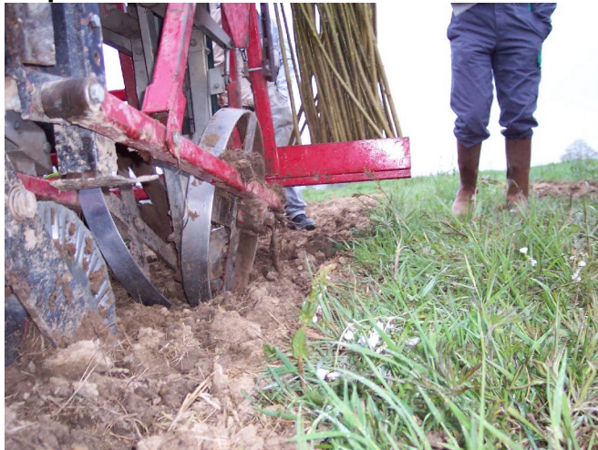
Un disque gaufré ouvre la terre