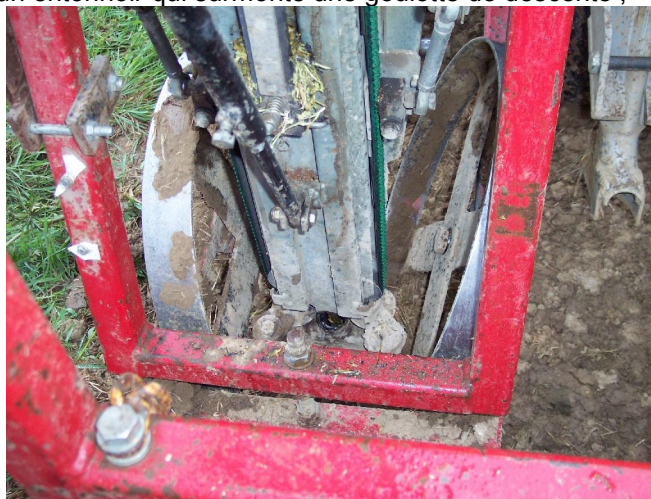
Système de coupe des boutures : à la base du système de guidage des tiges