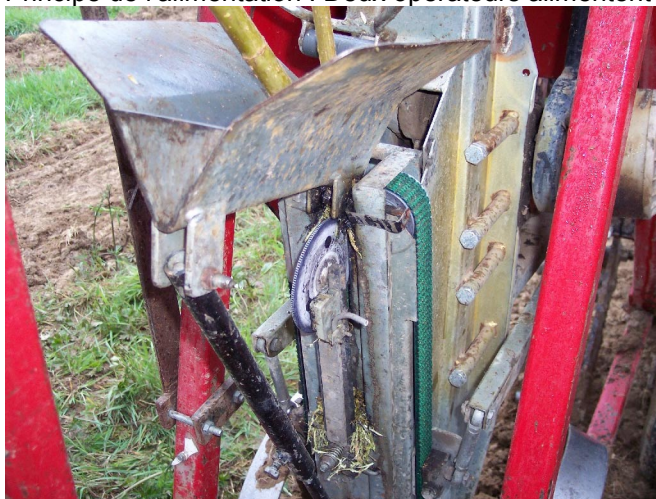
Entonnoir et courroie de guidage de la tige vers le sillon

Principe de l'alimentation : Deux opérateurs alimentent un entonnoir qui surmonte une goulotte de descente ;